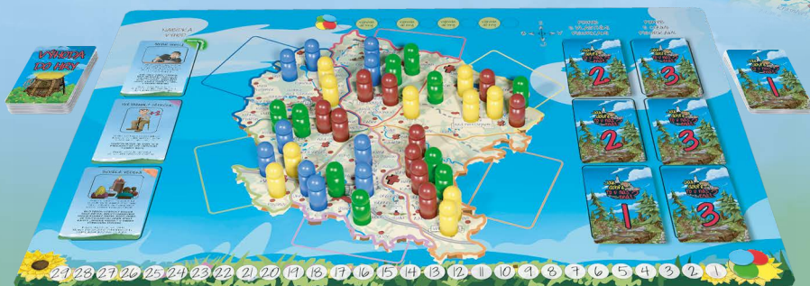
Příklad připravené hry pro 4 hráče